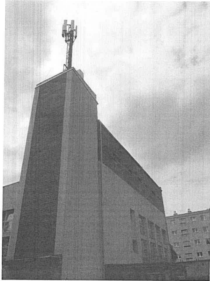
Zal. nr 1: Widok ogólny instalacji radiokomunikacyjnej.