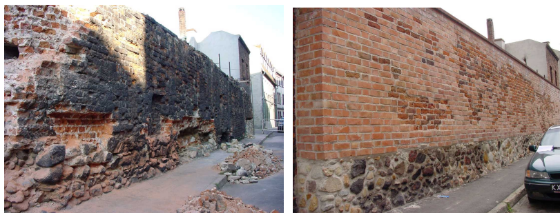
Odcinek murów miejskich, ul. Grodowa, stan przed i po pracach remontowo-konserwatorskich.