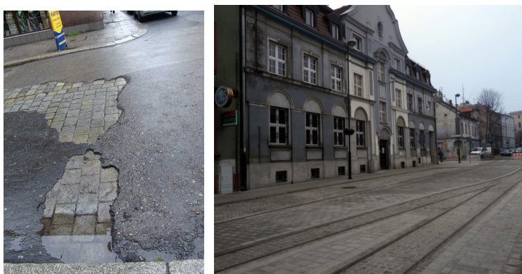
Nawierzchnia Starego Miasta, ul. Górnych Wałów, stan przed i po przebudowie.