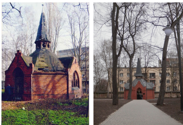
Kaplica, ul. Kozielska 8, stan przed i po pracach remontowo-konserwatorskich.