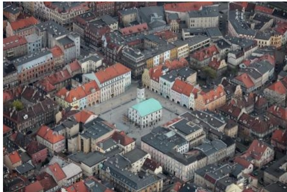
Rynek Starego Miasta i ratusz

Gliwice zostały założone w XIII wieku na prawie niemieckim. Miasto rozlokowano na wzniesieniu opadającym do doliny Kłodnicy opływającej Gliwice od wschodu i północy. Gliwice zostały rozplanowane w typowy dla miast śląskich sposób. Przecinająca je droga rozwidlała się w owalnicę, gdzie pośrodku wytyczono rynek. Do otoczonego murami miasta prowadziły dwie bramy: Biała (Bytomska) i Czarna (Raciborska).