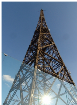
Maszt Radiostacji Gliwickiej przy ul. Tarnogórskiej

Obraz architektonicznego oblicza miasta nie byłby pełny bez wspomnienia o szczególnych dominantach przestrzennych, jakimi są m.in. wieże wodne, kominy, czy też wieża radiowa. Dwie wieże wodne zostały zlokalizowane w dwóch najwyższych punktach miasta. Jedna, neogotycka wzniesiona została w dzielnicy północnej, przy ul. Księcia Józefa Poniatowskiego, druga wybudowana w 1902 r. w kostiumie neoromańskim z elementami neogotyku położona jest w południowej części miasta, przy ul. Jana III Sobieskiego. W okresie międzywojennym Gliwice otrzymały własną rozgłośnię radiową „Sender-Gleiwitz”, wyposażoną w okazały drewniany maszt zlokalizowany na wyniesionym terenie północnej części miasta.