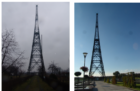
Zabudowania Radiostacji Gliwickiej, ul. Tarnogórska, stan przed i po pracach remontowo-konserwatorskich.