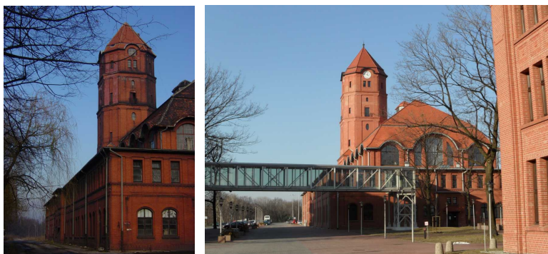
Zabudowania dawnej kopalni KWK Gliwice, ul. Bojkowska, stan przed i po rewitalizacji.