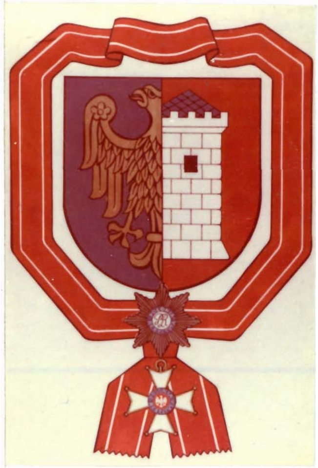
PREZYDIUM MIEJSKIEJ RADY NARODOWEJ W GLIWICACH