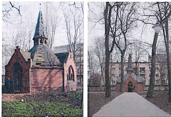
Kaplica, ul. Kozielska 8, stan przed i po pracach remontowo-konserwatorskich.