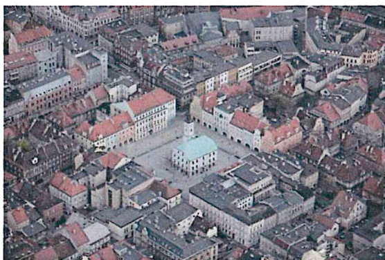
Rynek Starego Miasta i ratusz

Gliwice zostały założone w XIII wieku na prawie niemieckim. Miasto rozlokowano na wzniesieniu opadającym do doliny Kłodnicy opływającej Gliwice od wschodu i północy. Gliwice zostały rozplanowane w typowy dla miast śląskich sposób. Przecinająca je droga rozwidlała się w owalnicę, gdzie pośrodku wytyczono rynek. Do otoczonego murami miasta prowadziły dwie bramy: Biała (Bytomska) i Czarna (Raciborska).