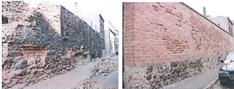
Odcinek murów miejskich, ul. Grodowa, stan przed i po pracach remontowo-konserwatorskich.