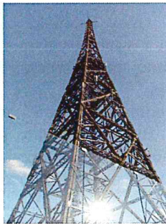
Maszt Radiostacji Gliwickiej przy ul. Tarnogórskiej

Obraz architektonicznego oblicza miasta nie byłby pełny bez wspomnienia o szczególnych dominantach przestrzennych, jakimi są m.in. wieże wodne, kominy, czy też wieża radiowa. Dwie wieże wodne zostały zlokalizowane w dwóch najwyższych punktach miasta. Jedna, neogotycka wzniesiona została w dzielnicy północnej, przy ul. Księcia Józefa Poniatowskiego, druga wybudowana w 1902 r. w kostiumie neoromańskiego z elementami neogotyku położona jest w południowej części miasta, przy ul. Jana III Sobieskiego. W okresie międzywojennym Gliwice otrzymały własną rozgłośnię radiową „Sender-Gleiwitz”, wyposażoną w okazały drewniany maszt zlokalizowany na wyniesionym terenie północnej części miasta.