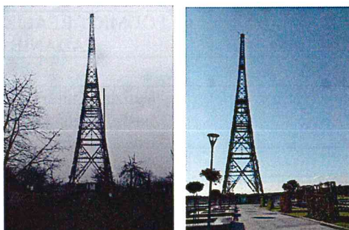
Zabudowania Radiostacji Gliwickiej, ul. Tarnogórska, stan przed i po pracach remontowo-konserwatorskich.