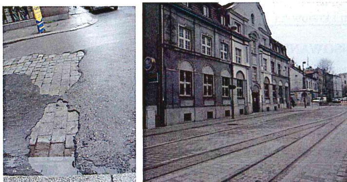
Nawierzchnia Starego Miasta, ul. Górnych Wałów, stan przed i po przebudowie.