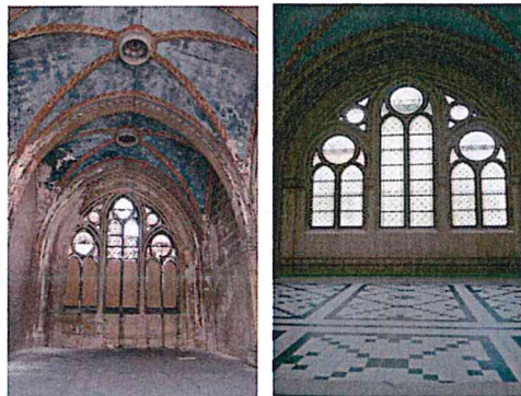
Żydowski Dom Przedpogrzebowy, ul. Ks. Józefa Poniatowskiego, stan przed i po pracach remontowo-konserwatorskich