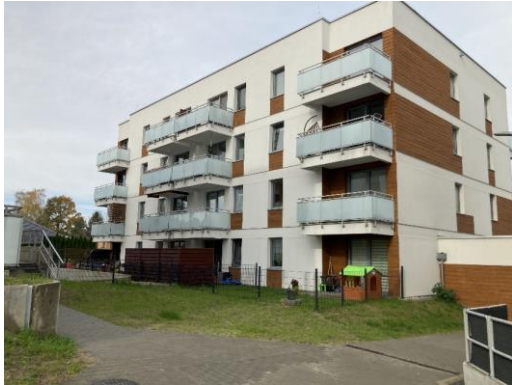
Kujawska I etap