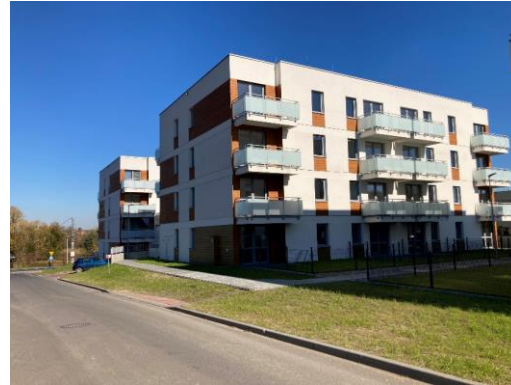
Kujawska II etap