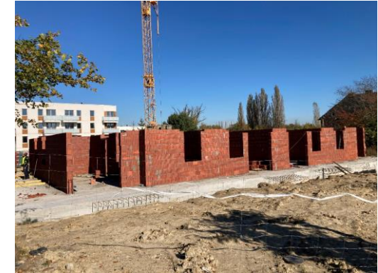
Kujawska III etap