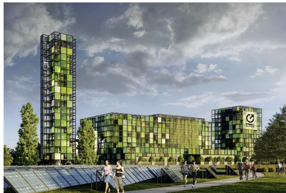
Grafika: PEC Gliwice