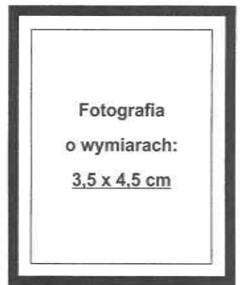
(nie wykraczać poza ramkę wewnętrzną)